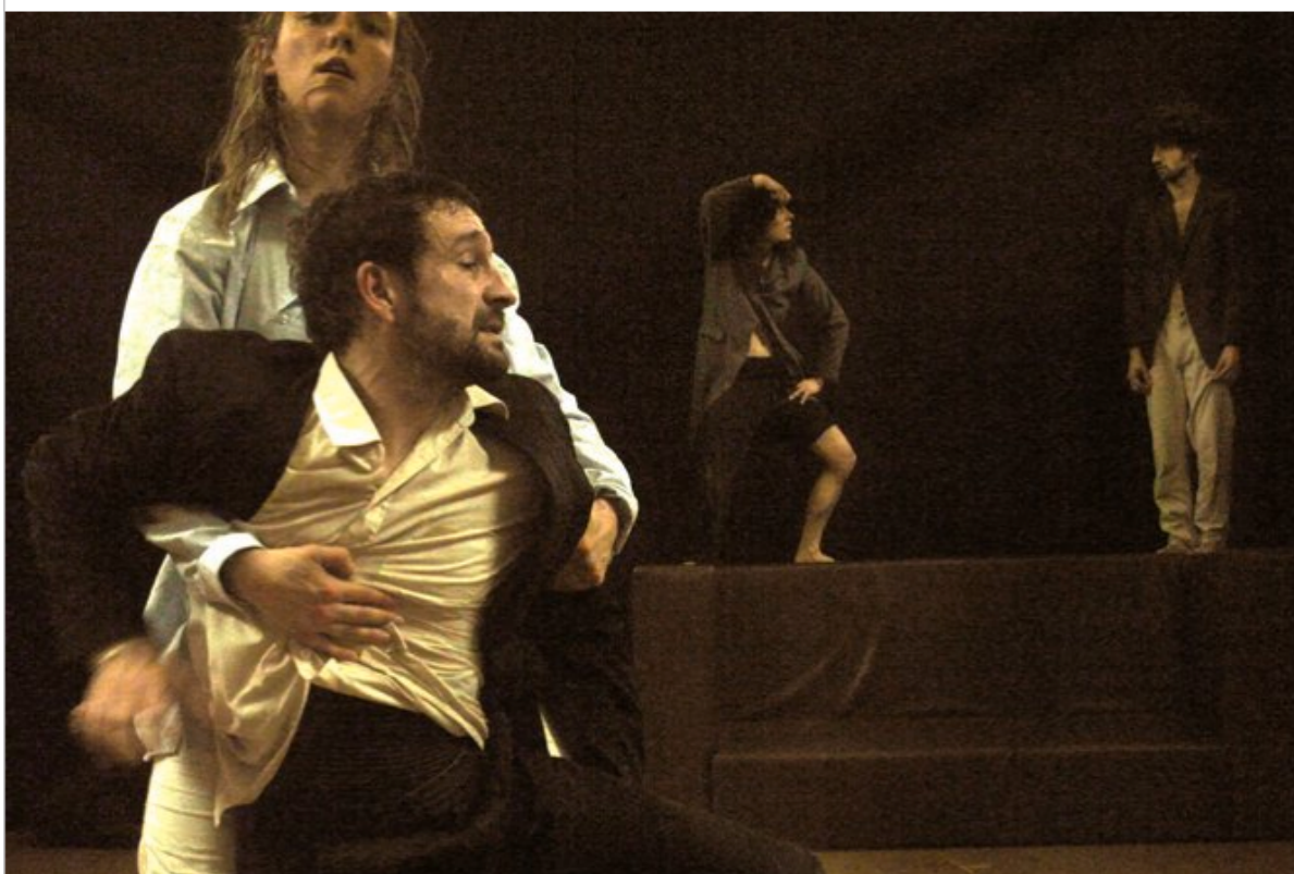
Légende : Les danseurs de Luciola en répétition, avant la première en France à la Briqueterie.

Karine Ponties ouvre le flambant neuf studio-scène de la Briqueterie avec un quatuor qui invite l'étrangeté du corps à se frotter à ses propres chimères.