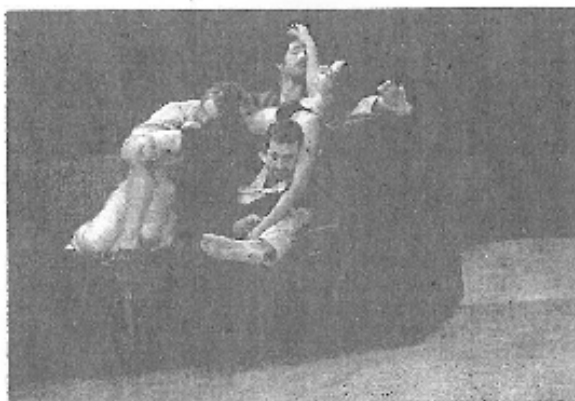
Un quatuor aux corps entremêlés.